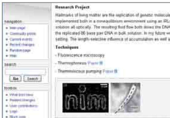
Jede Menge nützliche Informationen für Doktoranden: eine Seite des NIM-GP-Wikis

Das NIM-Graduiertenprogramm fördert außer dem Austausch unter den Doktoranden auch den mit anderen Nanoforschern weltweit. Jeder NIM-Doktorand kann Gelder im Rahmen des NIM-Seed-Fundings beantragen, um damit Forschungsaufenthalte an anderen Nano-Instituten zu finanzieren. Einen Reisebericht von so einem Aufenthalt finden Sie auf Seite 9. ■