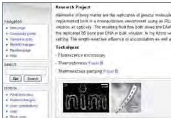
Jede Menge nützliche Informationen für Doktoranden: eine Seite des NIM-GP-Wikis

Das NIM-Graduiertenprogramm fördert außer dem Austausch unter den Doktoranden auch den mit anderen Nanoforschern weltweit. Jeder NIM-Doktorand kann Gelder im Rahmen des NIM-Seed-Fundings beantragen, um damit Forschungsaufenthalte an anderen Nano-Instituten zu finanzieren. Einen Reisebericht von so einem Aufenthalt finden Sie auf Seite 9. ■