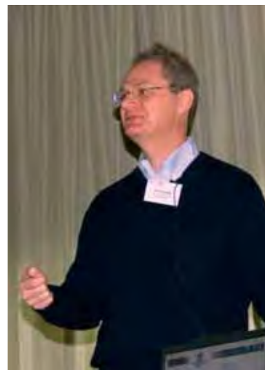
Paul Alivisatos gave a fascinating presentation at the NaNaX 4 conference.

Only a couple of months ago Berkeley scientists succeeded in converting 20% of the incident light quanta into hydrogen. If, in the future, one achieves water-splitting without the help of additives, the efficiency might be further increased. ■