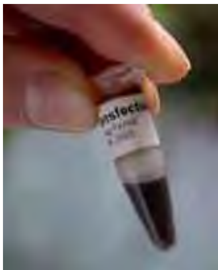
Magnetische Nanoteilchen für den Wirkstofftransport