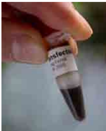
Magnetische Nanoteilchen für den Wirkstofftransport