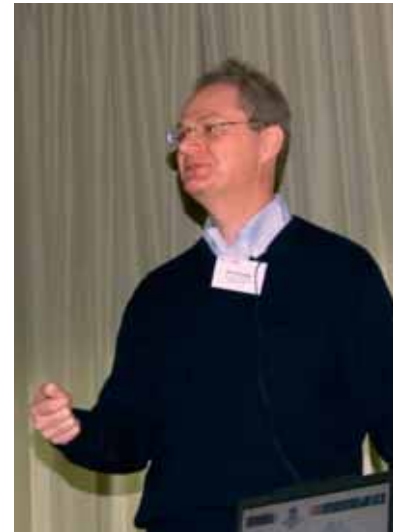
Paul Alivisatos gave a fascinating presentation at the NaNaX 4 conference.

Only a couple of months ago Berkeley scientists succeeded in converting 20% of the incident light quanta into hydrogen. If, in the future, one achieves water-splitting without the help of additives, the efficiency might be further increased. ■